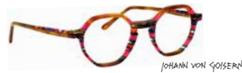
JOHANN VON GOISERN

Transparenz trifft auf dezente Farbstreifen – Style trifft gekonnt auf eine übergroße Form