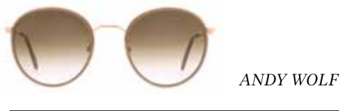
Andy Wolf ● ● ● ● Die coole, handgefertigte Panto Sonnenbrille Evan macht Lust auf den kommenden Sommer