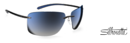
Silhouette Die randlosen, ultraleichten Streamline-Modelle verbinden Sportlichkeit und Eleganz