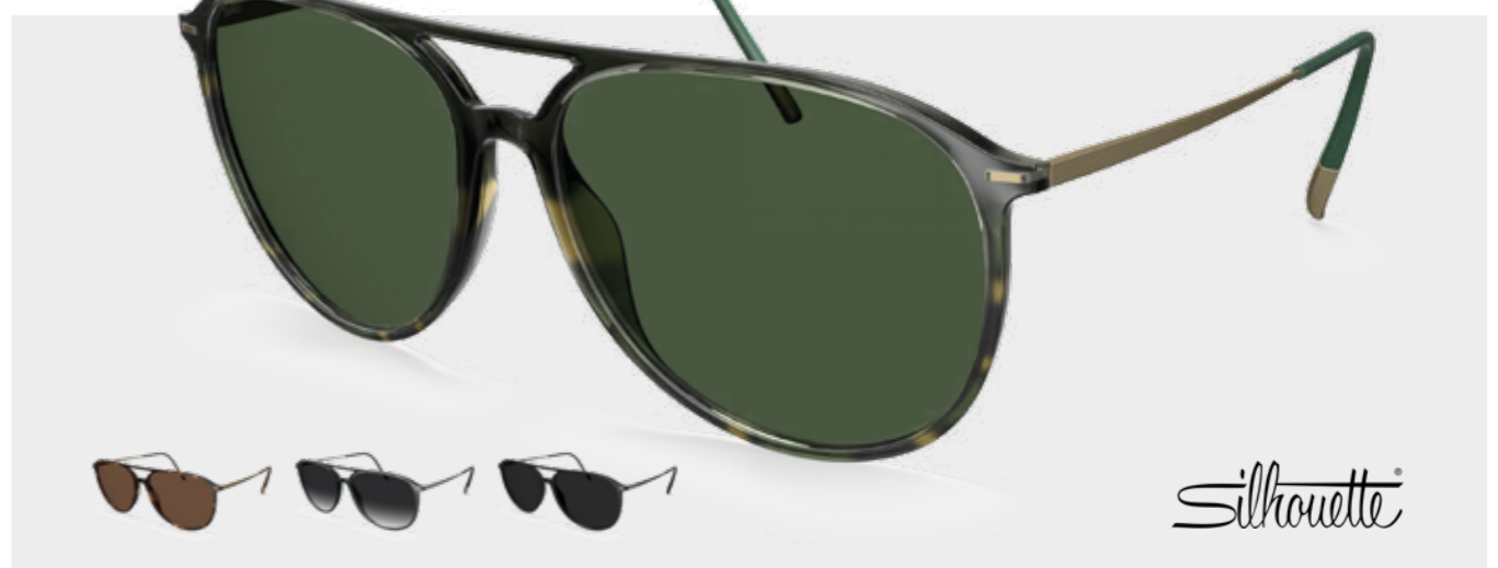
Das zeitlose Modell Brickell aus der Sun Lite Collection in der maskulinen Aviator-Form ist ein Must-have aus SPX®+ und Titan.

Sonnenbrillen sind Symbolbilder | ● = weitere Farbvarianten