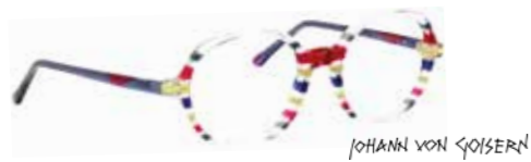
JOHANN VON GOISERN