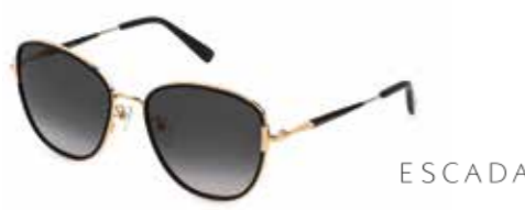
Escada Zeitlos eleganter Auftritt – rundliche Silhouette und graue, elegante Verlaufsgläser