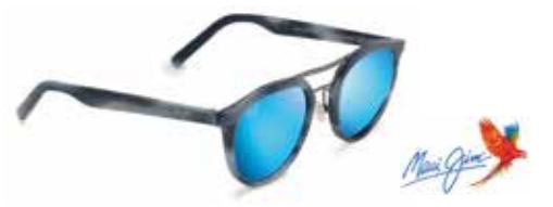
Maui Jim Sunny Days begeistert mit italienischem Acetat, Edelstahl & PolarizedPlus2® Gläsern