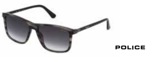
Police Klassiker für alle Gelegenheiten: eckig geformtes Azetat mit Vintage POLICE Logo