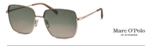
MARC O'POLO Eyewear ● ● ● ● Hollywood meets Stockholm: fein abgesetztes Metall bringt den besonderen Farbeffekt

Sonnenbrillen sind Symbolbilder | ● = weitere Farbvarianten